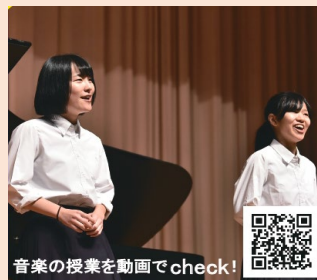
音楽の授業を動画でcheck!

国公立大学や難関私立大学に加え、看護医療系、芸術系など多様な進路に対応したカリキュラムを設置しています。普通科高校には珍しい「専門美術」や「専門音楽」の授業もあり、芸術系を目指す生徒に手厚く指導を行っています。