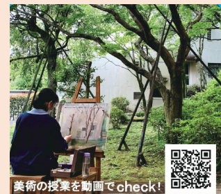
美術の授業を動画でcheck!